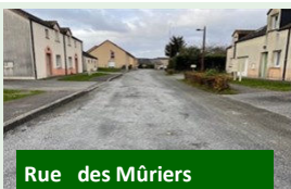
Rue des Mûriers