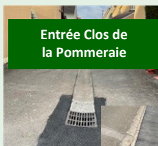
Entrée Clos de la Pommeraie

Des travaux de voirie ont été effectués à différents endroits de Cerisé.