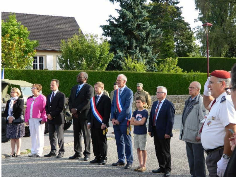
Deuxième cérémonie de la « Route Leclerc » le 16 août 2019